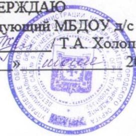
СХЕМА БЕЗОПАСНОГО ПОДХОДА К МБДОУ Д/С № 9